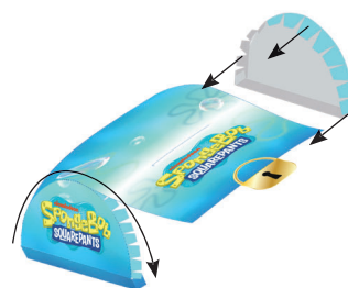
LIPEȘTE PARTEA 3 DE PARTEA 4