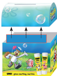
LIPEȘTE PE INTERIORUL CAPACULUI

LIPEȘTE PARTEA DIN SPATE A CUFĂRULUI DE INTERIORUL CAPACULUI, ASTFEL ÎNCÂT CELE DOUĂ PĂRȚI SĂ SE UNEASCĂ.