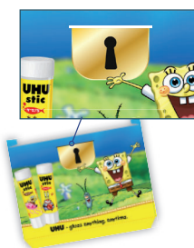
TAIE O FANTĂ

TAIE O FANTĂ PE LINIA NEGRĂ DE PE PARTEA 1. LIPEȘTE PĂRȚILE 1 ȘI 2 ÎNTRE ELE PENTRU A FORMA CUTIA. PE LATURILE SCURTE, ÎNDOAIE MARGINILE SPRE INTERIOR ȘI LIPEȘTE-LE.