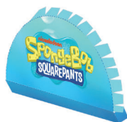
DECUPEAZĂ ȘI ÎNDOAIE MARGINILE

DECUPEAZĂ PĂRȚILE 4 ȘI 5 PE LINIILE CONTINUE ȘI ÎNDOAIE MARGINILE SPRE INTERIOR. LIPEȘTE MAI ÎNTÂI PARTEA 3 DE MARGINILE PĂRȚII 4, APOI DE PARTEA 5.