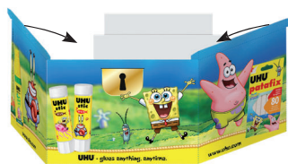
LIPEȘTE PĂRȚILE 1 ȘI 2 ÎMPREUNĂ PE MARGINI